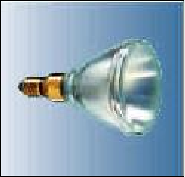
LUMINARIA L1 EMPOTRABLE EN TUMBADO